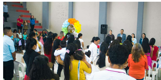
Fotografía: Área de comunicación municipal, 2024. MIÉRCOLES /13/marzo/2024

Coordinación con técnicos de ECOPAR MULTISERVICIOS FORESTALES, Técnicas municipales de ambiente y granja municipal para el recibimiento de las plantas a usarse en el proyecto de reforestación.