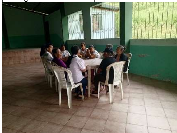
JUEVES /07/marzo/2024

Reunion con presidenta de la comisión del área social, adultos mayores de la Cdla. 9 de Octubre, para socialización de la construcción de la Ordenanza para garantizar el cumplimiento de las exoneraciones de los impuestos municipales a las personas adultas mayores del Cantón Marcabellí