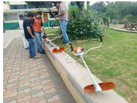
Fotografía: Ramírez D., 2024, LUNES /18/marzo/2024

Conversatorio con alcalde y comisión social sobre temas manifestados por los técnicos del área social