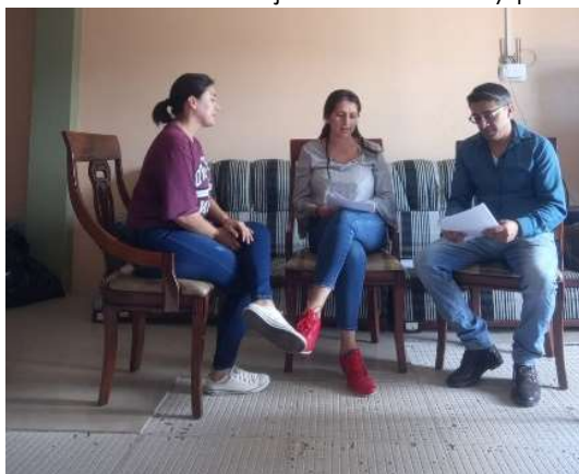
MARTES /26/marzo/2024

Conversatorio con jefe de tránsito y presidenta de la comisión social por temas de tránsito que se están revisando en la ordenanza del adulto mayor