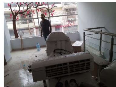
MARTES /05/marzo/2024