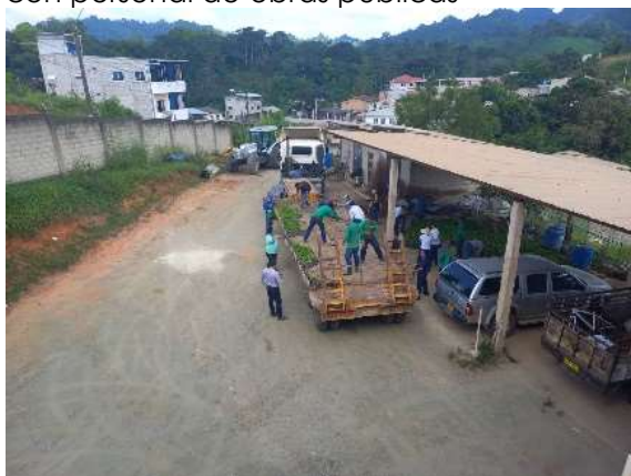
Fotografía: Reyes P., 2024. MIÉRCOLES /27/marzo/2024

Coordinación con alcalde y director de obras públicas para el recibimiento de plantas de café enviado por la prefectura de El Oro y descarga de plántulas con personal de obras públicas