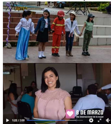
Fotografía: Área de comunicación municipal, 2024. VIERNES /08/marzo/2024