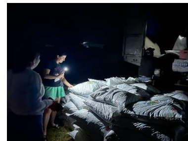
Fotografía: Ramírez D., 2024, LUNES /18/marzo/2024

Reunión con personal obrero de ECOPAR MULTISERVICIOS FORESTALES e inicio de las plantaciones