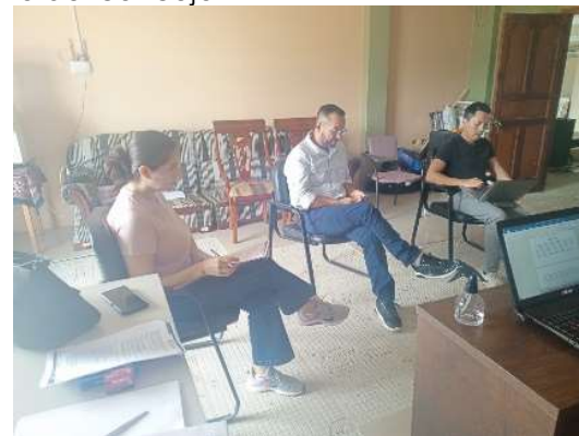
JUEVES /28/marzo/2024

INDIVIDUALMENTE, SOMOS GOTA. JUNTOS, FORMAMOS UN OCÉANO.