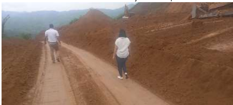
Fotografía: Cabrera R., 2024. MIÉRCOLES /13/marzo/2024

Fiscalización de avance de trabajos de la prefectura en vía Villaseca en compañía de Alcalde y presidente de la comisión de servicios públicos