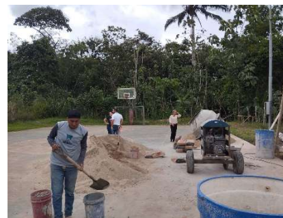
VIERNES /22/marzo/2024

Conversatorio con jefe de tránsito y presidenta de la comisión social por temas de tránsito que se están revisando en la ordenanza del adulto mayor