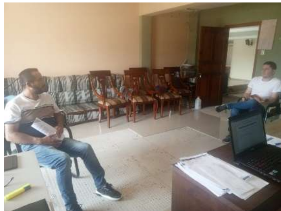
Fotografía: Aguilar A., 2024, VIERNES /01/marzo/2024

Revisión de instalaciones de mercado por daños ocasionados por lluvias en conjunto con personal de obras públicas, comisaría municipal y presidente de la comisión.