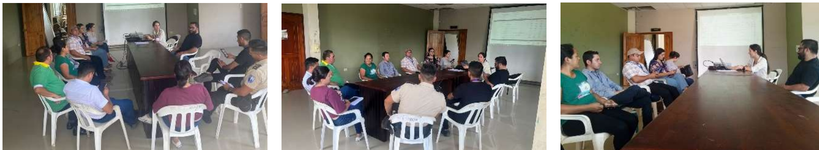
MARTES /26/marzo/2024

Mesa Técnica Intersectorial de la Secretaría Técnica Ecuador Crece sin Desnutrición Infantil – STECSDI