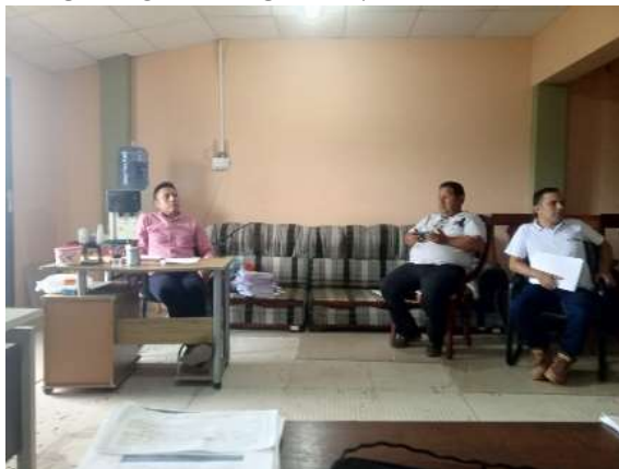
MIÉRCOLES /13/marzo/2024

Evento de conformación del consejo cantonal de protección de derecho