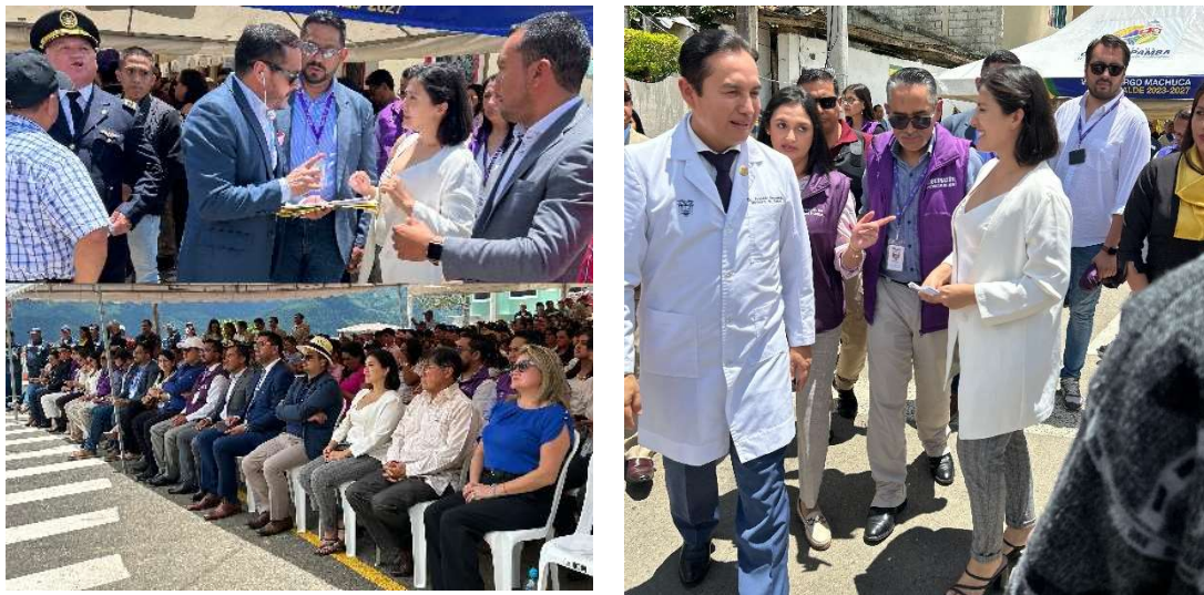
Fotografía: Ramírez D., 2024. JUEVES /21/marzo/2024

Asistencia a Evento en el cantón Chaguarpamba de la provincia de Loja, con la presencia del Ministerio de Salud y coordinador zonal de salud.