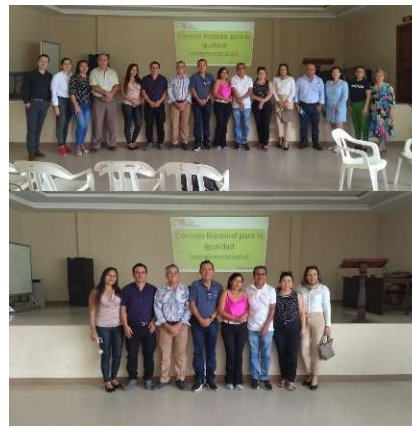
MIÉRCOLES /13/marzo/2024