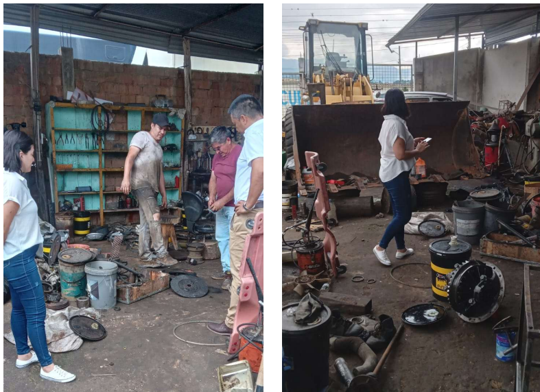
MIÉRCOLES /13/marzo/2024

Fiscalización de trabajos de reparación mecánica de equipo caminero en compañía de Alcalde y presidente de la comisión de servicios públicos