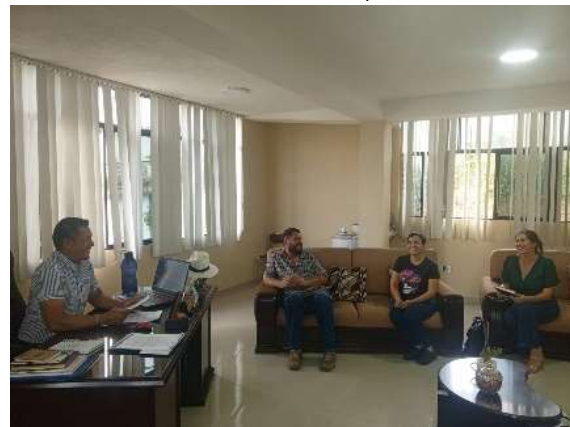
LUNES /18/marzo/2024