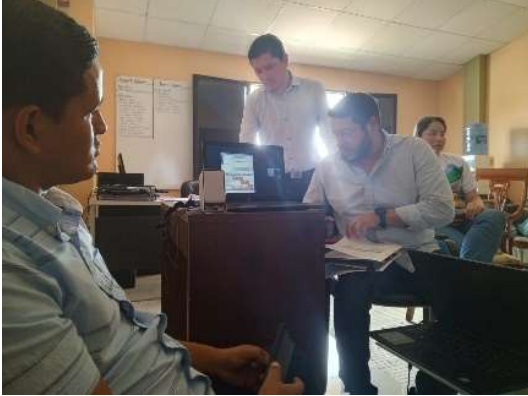
JUEVES /07/marzo/2024

Reunion con director de planificación y equipo consultor de actualización del PDOT para la planificación del inicio del proceso