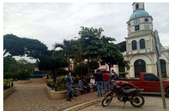
Fotografía: Reyes P., Aguilar A., 2024. MARTES /19/marzo/2024